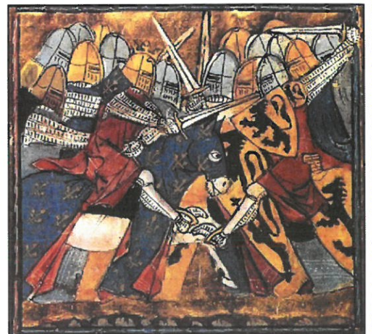
Doc t 4 : Chevaliers - enluminure du XIV e siècle